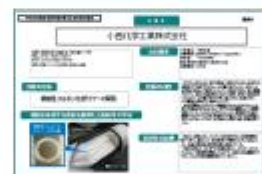
和歌山県1社1元気技術

顧客ニーズをくみ取りながら、化学だけにとどまらず、何でもありのサイエンスを擦り合わせて研究に挑み続けている。